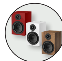
Erhältlich in Schwarz, Weiß, Rot & Holz