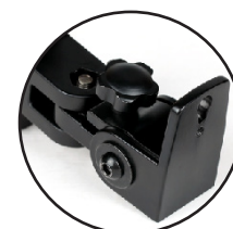
Wandhalterung separat erhältlich